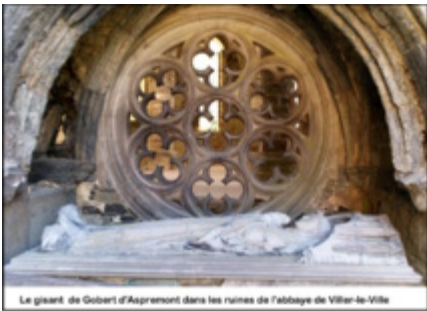
Le gisant de Gobert d'Aspremont

Gobert d'Aspremont dit « le Bienheureux », né vers 1187, est un chevalier de la noblesse française qui a notamment participé à la 6 ème croisade et aurait à son retour, effectué un pèlerinage à Compostelle pour ensuite devenir moine cistercien à l'abbaye de Villers-en Brabant 1 .