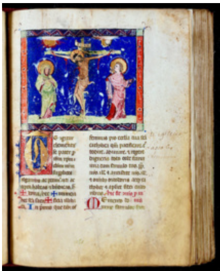
Folio CLXXXIII recto

Ce type d'ouvrage pouvait avoir deux vocations très différentes au Moyen-âge. Il pouvait s'agir d'un livre d'apparat ou d'usage. Un missel d'apparat n'était pas destiné à être utilisé mais, de par ses ornements, il devait manifester l'appartenance de son propriétaire à la bonne société, contrairement à un missel destiné à être utilisé par un prêtre pour célébrer des messes.