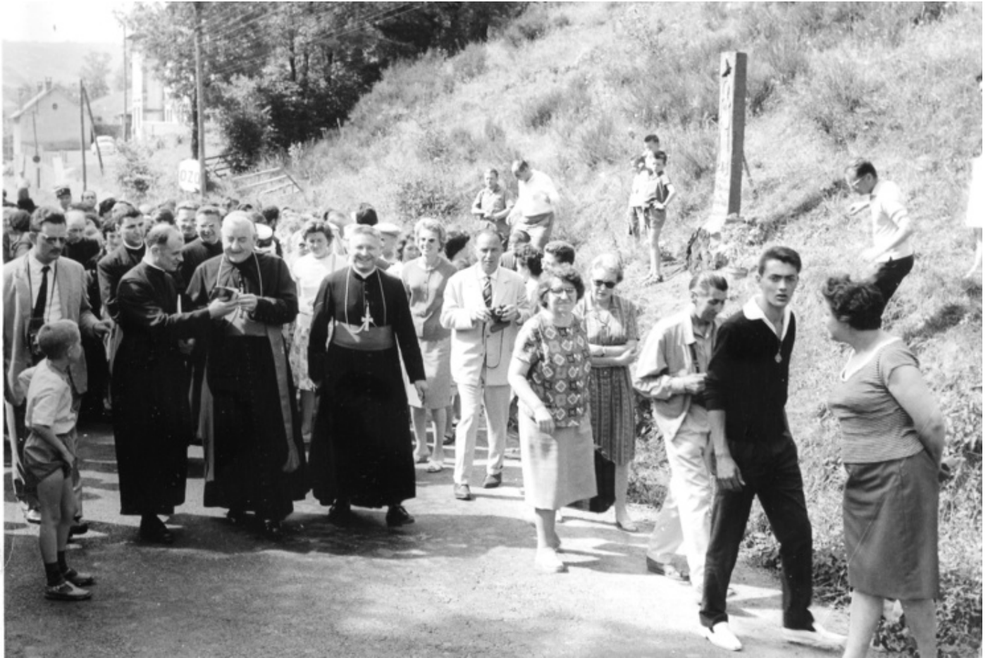
Après la bénédiction, le retour de la procession. L'abbé Jammet présente à Mgr Quiroga le document souvenir de cette journée. A droite, Mgr Pouchet

Dans la prochaine lettre l'intégralité du discours et mes commentaires qui le replaceront dans l'histoire du début des années 1960.