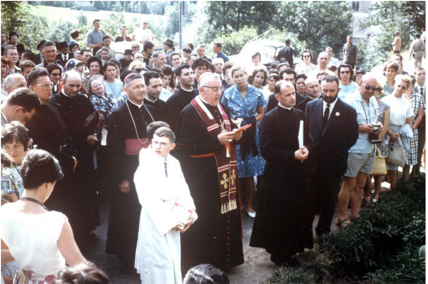
La foule devant la stèle

Au pied de la stèle se sont regroupées les autorités religieuses et civiles. Au centre Mgr. Quiroga avec, à sa gauche l'abbé Jammet et, légèrement à l'arrière, Mgr. Pourchet. A la gauche de ce dernier, deux prêtres espagnols, à sa droite, deux prêtres.