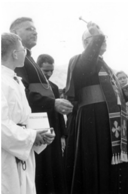
Le grand moment