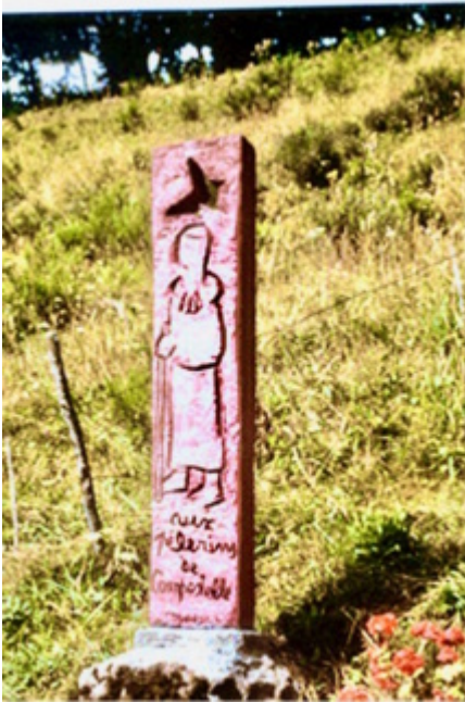
La stèle sur le lieu de sa bénédiction