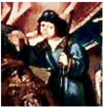
Compostelle, Museo de las Peregrinaciones. Don de Jacob Cornelisz van Ootsanen (1470-1533

Costumé comme les paysans danois, l'enfant aux joues rondes porte épée et bourdon. D'un air décidé, il semble prêt à partir et tourne déjà le dos à sa mère. Pourquoi lève-t-il le bras droit, poing fermé ?