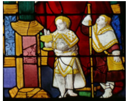
Louviers, église Notre-Dame, baie 18, XVIe siècle.