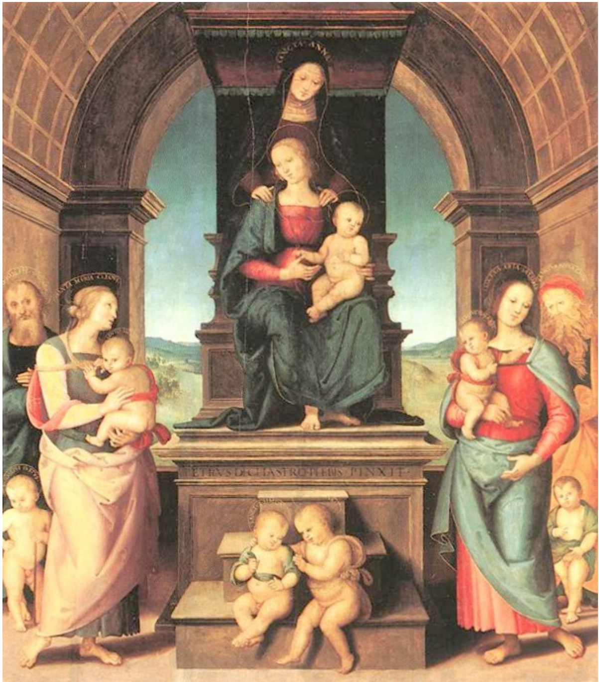
Pérugin, " La Sainte Parenté " Marseille, musée des Beaux-Arts

Voici l'image type d'une Sainte Parenté figurant dans le document d'Annie Cloulas-Brousseau. Sainte Anne et la Vierge, tenant Jésus enfant, sont seules sur un piédestal. Joachim et Joseph ne sont jamais représentés.