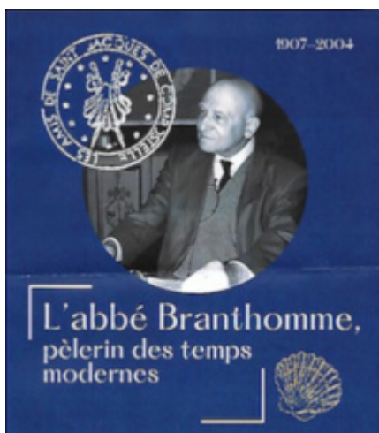
Opuscule de l'EGPR pour le 12 déc. 2023

Après la projection du film à Paris le 12 décembre, organisée par les Archives de l'Eglise de France avec notre concours, nous avons reçu ce message d'un ami de l'IRJ :